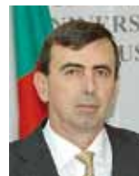
Проф. д-р Пламен Кангалов Раздел „Цялостен принос и дългогодишна дейност в областта на висшето образование и наука“