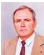
Проф. д-р Руси Русев Раздел „Висше образование и наука“